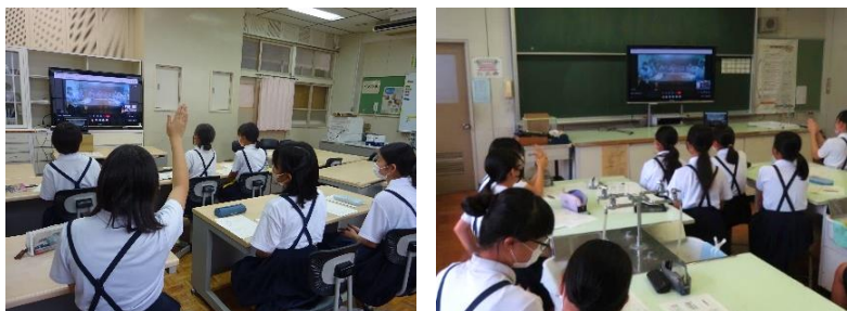
【小学校】三校リモート会議に参加している小学生

むかし、朝日山の近くの安良(やすろ)川は、「精(しらげ)川」とよばれていました。その精川は、きれいな水が流れ、川底の白い石が透き通って見えていたそうです。100年ほど前、鳥栖西中学校は「精(しらげ)高等小学校」と呼ばれていて、今の轟木・旭・麓地区の子供たちが通っていました。そしておよそ50年前(S.43)に今の鳥栖西中学校ができました。鳥栖西中学校と旭小学校、麓小学校の子供たちが精川のように、きれいな心で元気に育てほしいという願いを込めて生まれたキャラクターです。この精ちゃんは、勉強(鉛筆)、心の栄養(じょうろ)、頭の花はみんなの成長している姿を表しています。