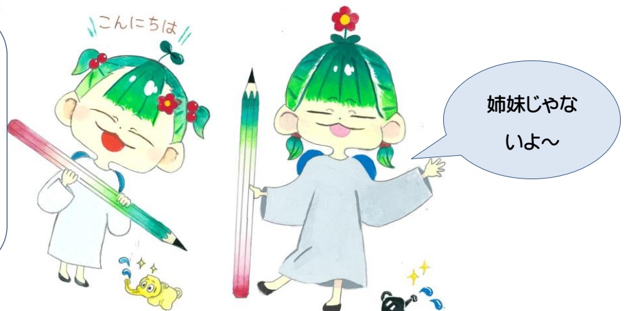
【中学校】精ちゃんに込めた想いを全クラスに伝える学習委員

精ちゃんのコンセプト ・「精(しらげ)」をイメージするもの 精…白くする・美しくきれいにする・最も純粹 でよいもの・すぐれたもの・人間以外の不思議な力をもつもの・精霊・気力・根気・生命の根本の力・明らか・清い・真心 ・スクールカラー(西中は緑、麓小は小豆色、旭小は朱色)が入っていること。緑を基調にどこかに赤が入っている感じで。 ・架空のキャラクターであること