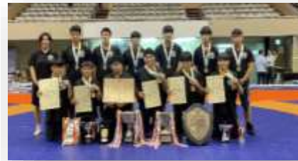
北海道総体2023で王座奪還のレスリング部