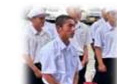
8月17日本校に凱旋。「田舎の県立高校でも強豪校と勝負ができることを全国に示せた」と高陽主将。