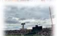
2回戦のためにまた再び夢の球場に戻ってきました。