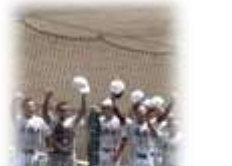
野球部のみなさん、感動をありがとうございました!