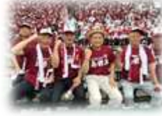
山口祥義佐賀県知事も応援に駆けつけて下さいました!