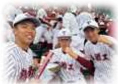
2回戦は大観衆でスタンドは埋め尽くされました。

県大会に引き続き甲子園でも熱い戦いを見せてくれた本校野球部。甲子園で1回戦の対富山商業戦は全国の高校野球ファンから「名勝負」と多くの称賛の声が上がりました。タイブレークの末接戦をものし、県勢としては10年ぶりに一回戦を突破しました。2回戦は過去優勝2回という強豪校の日大三高との対戦。見応えある接戦の末、惜しくも敗れました。しかし、その全力プレイと素晴らしいチームワークで学校関係者、生徒、保護者は元より、鳥栖市民、そして全国の人々に感動を与えたことは言うまでもありません。野球部のみなさん、熱く感動的な夏の思い出をありがとうございました!