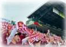
全校一丸となった応援!