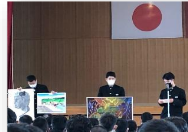
美術部は作品を持って登場