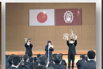
溶接部は作品を掲げてアピール