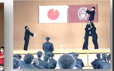
軽やかなパフォーマンスのラクビー部