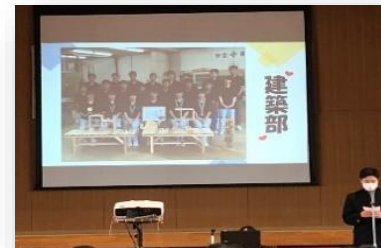
もの作り大好きな人集まれ! 建築部!