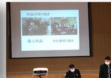
メディア部とは何をやる部活なのか分かり易く説明