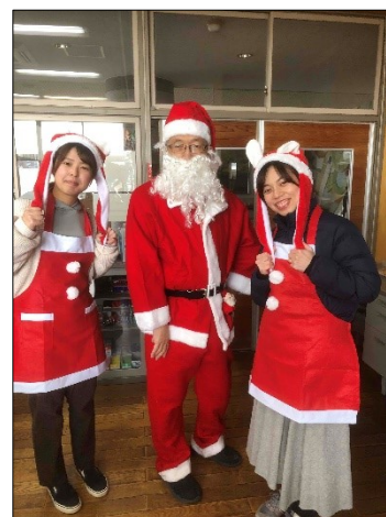
北小にサンタがやってきて、給食のデザートに配ってくれました。