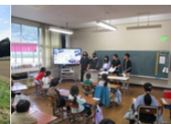
6年 修学旅行報告会