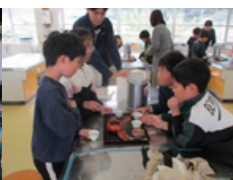
3年 お茶の淹れ方教室