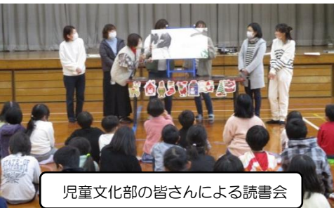
児童文化部の皆さんによる読書会

12月に入り、一段と寒さが厳しくなる時期を迎えました。校庭の桜の木々たちも、すっかりと葉を落とし、本格的な冬支度ができているようです。