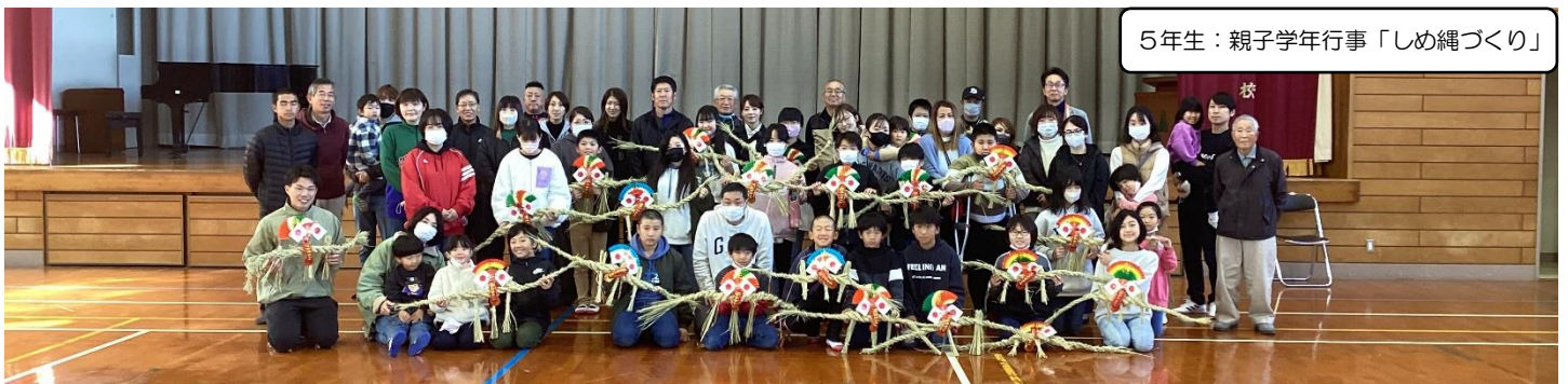
5年生：親子学年行事「しめ縄づくり」

夢を持ち、ふるさとを愛し、生き生きと学ぶ轟っ子の育成 ~高い志を持つ、持続可能な社会の創り手とするために~