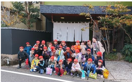
温泉旅館の前で「はい！ポーズ！」

「とても感動しました！」日頃より、子供たちへの読み聞かせのために来校いただいている地域の方から、そのようなお言葉をいただきました。子供たちのトイレの使い方や行き届いた掃除を見て、うれしくなられたそうです。使った後のスリッパがきちんと並んでいること、トイレトペーパーの切れ端も床に落ちていないこと、手洗い場の流しがきれいになっていることなど、いいところをたくさん伝えていただきました。