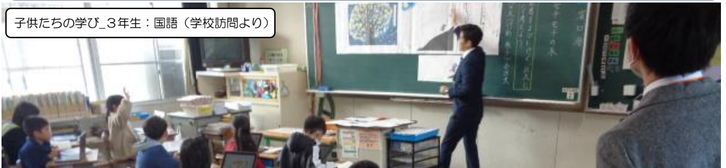
子供たちの学び_3年生：国語（学校訪問より）

夢を持ち、ふるさとを愛し、生き生きと学ぶ轟っ子の育成 ～高い志を持つ、持続可能な社会の創り手とするために～