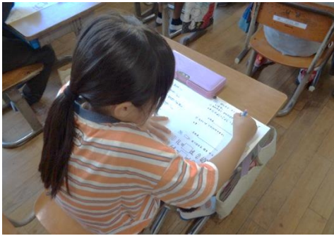
復習プリントに集中している子供（2年）