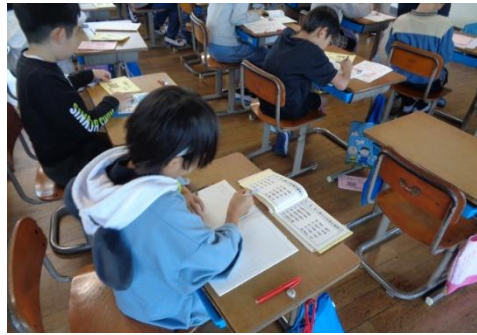
計算力アップに取り組む子供たち（4年）