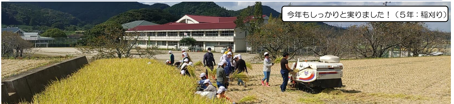
今年もしっかりと実りました！（5年：稲刈り）

夢を持ち、ふるさとを愛し、生き生きと学ぶ轟っ子の育成 ～高い志を持つ、持続可能な社会の創り手とするために～