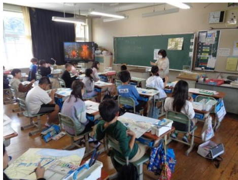
絵画指導を受ける6年生

実りの秋を迎え、また、2学期もスタートし、子供たちも1日1日の学校生活を充実させようと張り切っているところです。 2学期の始業式では、「1学期と同じように、この2学期も、できることをたくさん増やしてほしい！」と話したところです。そのためには、「失敗や間違いを恐れず、挑戦、チャレンジすること」そして、「挑戦しチャレンジしている友達を励まし勇気づけること」と付け加えたところです。