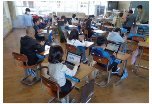
書き直し後、AIドリルに取り組む子供たち（3年）

国語や算数など、1つの単元の学習をした後は学習した内容の確認のためにテストがあります。また、日々の学習では、授業中や宿題などで、プリントやドリルにも取り組みます。それらのテストやプリントなどは丸付け後に返却されますが、その時に間違っていたところの書き直しが、子供たちの学習を積み重ねていく上でとても大事になってくると考えています。