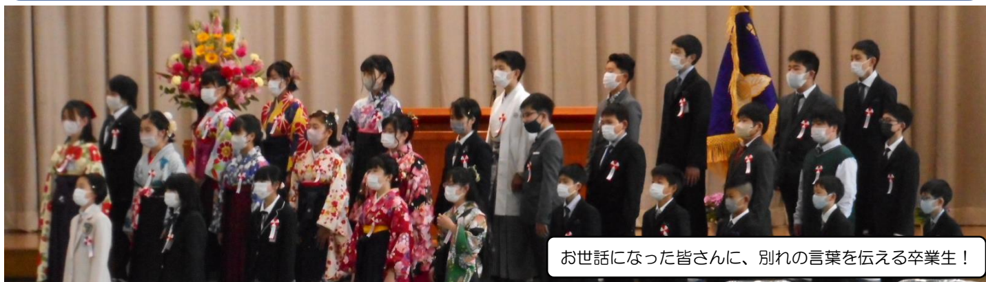
お世話になった皆さんに、別れの言葉を伝える卒業生!

夢を持ち、ふるさとを愛し、生き生きと学ぶ轟っ子の育成 ~高い志を持つ、持続可能な社会の創り手とするために~