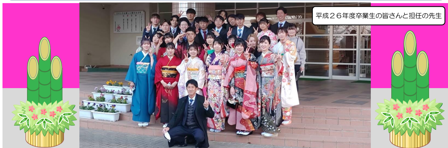
平成26年度卒業生の皆さんと担任の先生

夢を持ち、ふるさとを愛し、生き生きと学ぶ轟っ子の育成 ~高い志を持つ、持続可能な社会の創り手とするために~