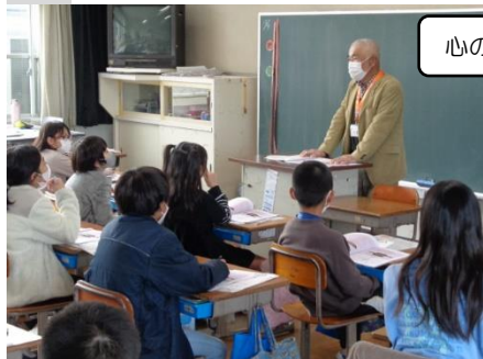
心のバリアフリー教室