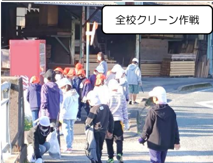
全校クリーン作戦

前号だけでは紹介ができなかったもので、引き続き、多くの方々に本校の教育活動を支えて頂いていることについてお伝え致しています。