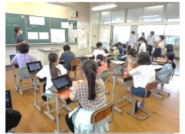
6年生の公開授業の様子

ノートの書き方や自学ノートへの取り組みなどは、この小中連携での取組の一つになります。校区内で、子供たちの義務教育9ヵ年の学びについて連携を図っているところです。