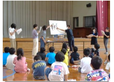
児童文化部の方による読み聞かせ

また、その日の5時間目には、PTA 児童文化部の役員の方々を中心に、1から3年生の子供たちに大型絵本などの読み聞かせを行って頂きました。