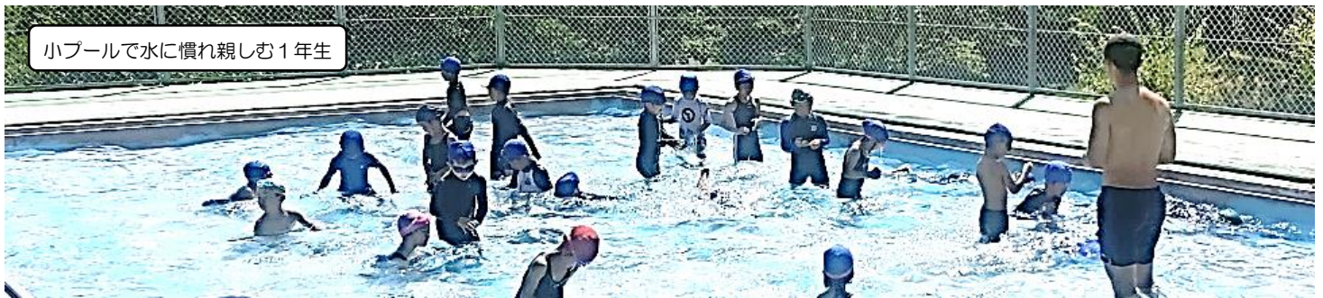
小プールで水に慣れ親しむ1年生