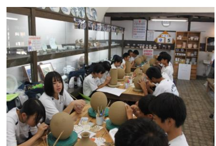
ランプシェードの製作