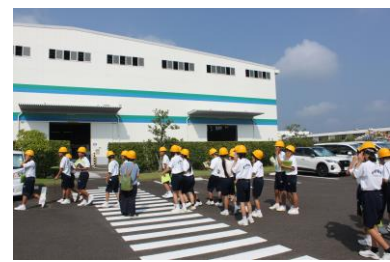
東亜工機の工場内の見学