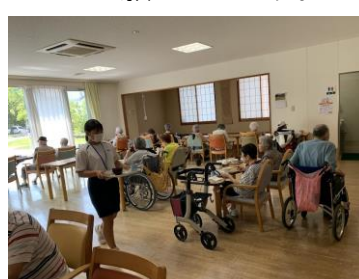
「ケアコートゆうあい」