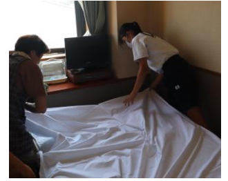
「スカイタワーホテル」