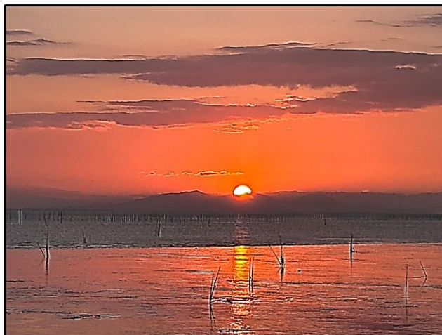
有明海からの初日の出