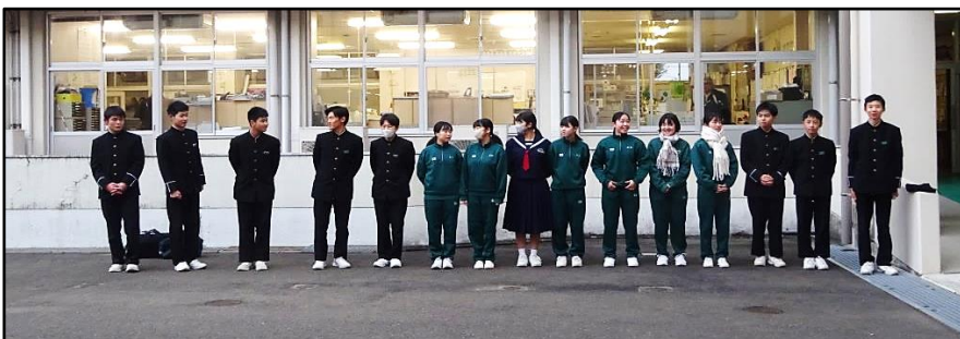
生徒玄関前であいさつ運動をする生徒会役員

12月22日（金）の全校集会では、来年の1月より活動をする生徒会執行部及び専門委員会委員長・副委員長の15名に任命状を渡し、後の全校集会の中では、生徒会活動について次のような話をしました。