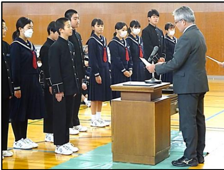
任命状を受け取る新会長