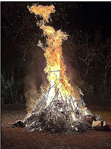
松岡神社のお火たき