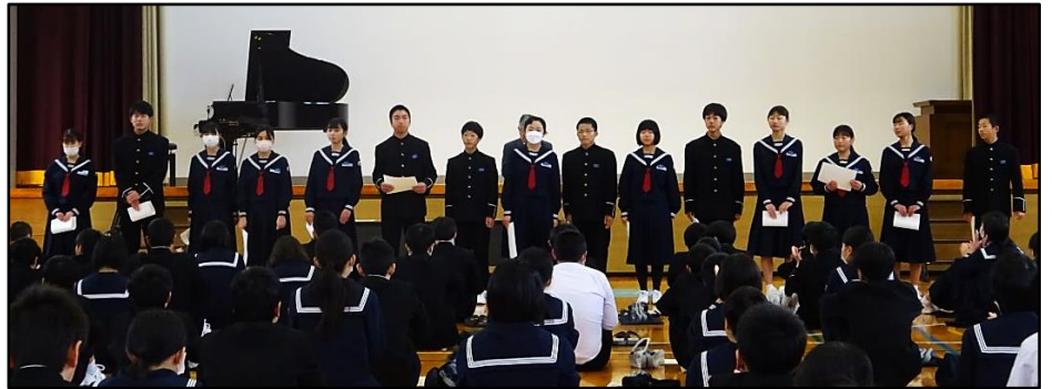
任命状を受け取った生徒会役員