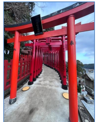
祐徳稲荷神社の鳥居

※ 東部中学校ホームページ(右のQRコード)に「学校だより」をアップしています。 写真やイラストなどカラーで載っていますので、是非ともご覧ください。