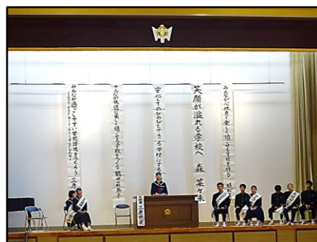
生徒会長選挙 立候補者の演説会の様子