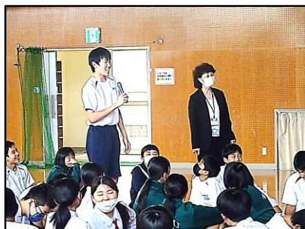
子どもたちの意見を聞きながら