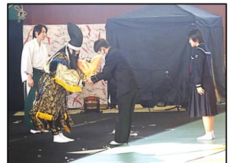
演者の方へのお礼