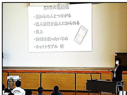
分かりやすい説明でした