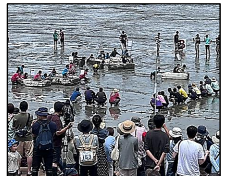
ガタリンピック 競技の様子