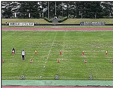
鹿島市スポーツフェスタ会場

いずれの大会も4年ぶりの開催となり、多くの方が参加者や観客として、会場に訪れていました。