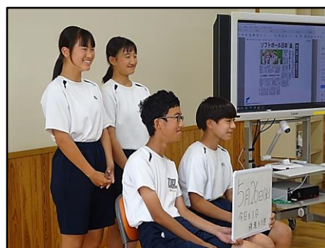
記事掲載の写真の撮影