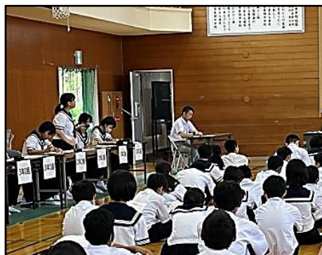
学級代表からの提案に対する質問