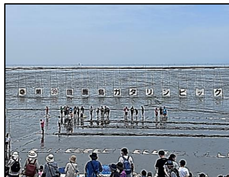
鹿島ガタリンピック会場