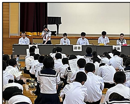
専門委員長からの提案