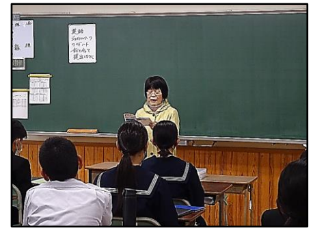
各学級での読み聞かせの様子