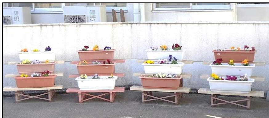
生徒玄関前に並べられたプランター