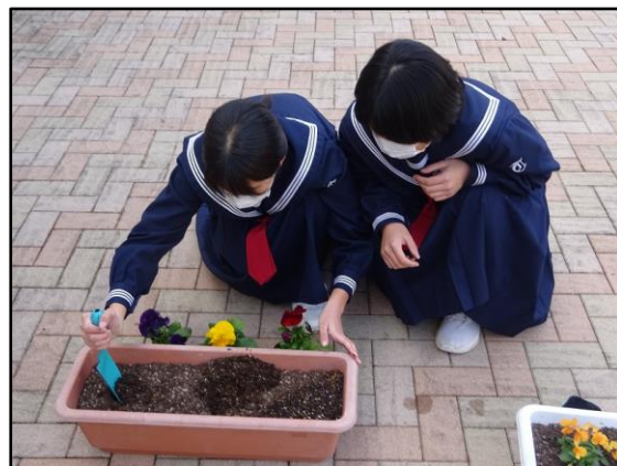
卒業生のために気持ちを込めて花を植えました。