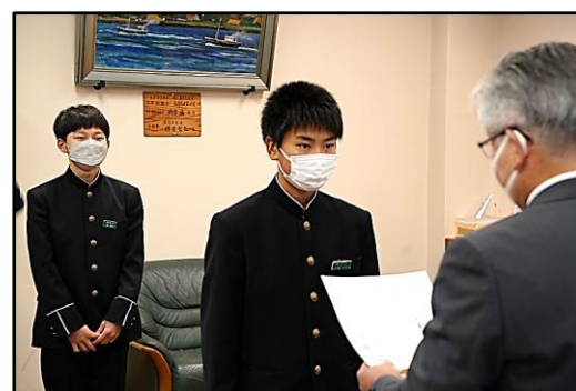
生徒会長及び執行部の任命

冬休みも終わり、3年生は、進路決定に向けて大切な時期となります。1・2年生は、それぞれの学年のまとめの時期となるとともに、次の学年への準備の時期でもあります。2年生は、11月に選挙で決まった生徒会長をはじめとして、副会長・総務も決まり、活動に取り組んでいるところです。12月22日(木)には、3年生の生徒会からの引継ぎも終わり、今月末には生徒総会も予定されています。いよいよ今後の東部中学校を支える新しいリーダーとしての活躍の時期となってきました。