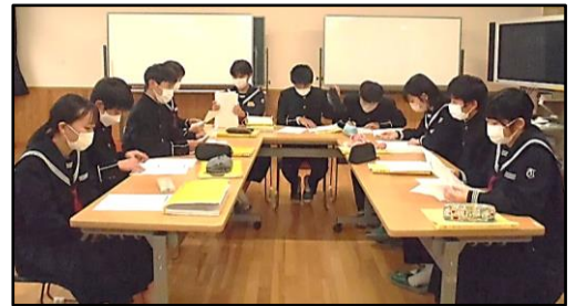
新旧生徒会執行部の引継ぎ会

12月22日(木)に生徒会引継ぎ会が行われました。新旧の生徒会執行部の役員を中心にそれぞれの委員会で引継ぎ会を行いました。3年生の旧生徒会執行部は、2年生の新生徒会執行部へバトンを渡すこととなりました。これを機に3年生は、受験に向けて本腰