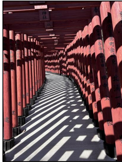
祐徳稲荷の千本鳥居