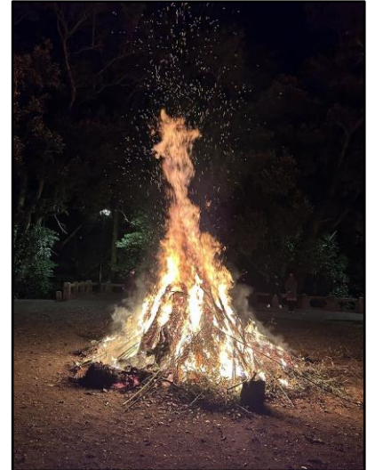
松岡神社のお火焚き