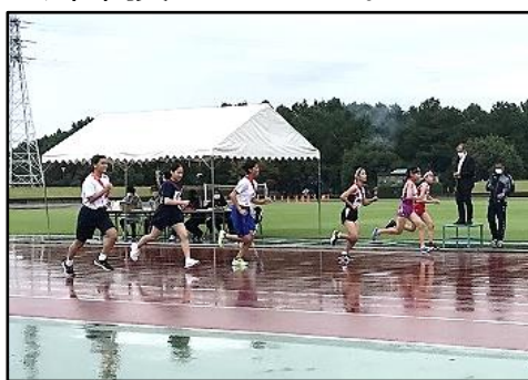
駅伝女子のスタート