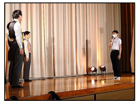
生徒を代表してお礼の言葉