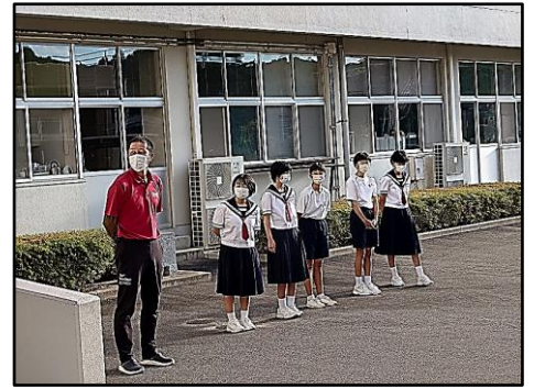
あいさつ運動の様子 ③