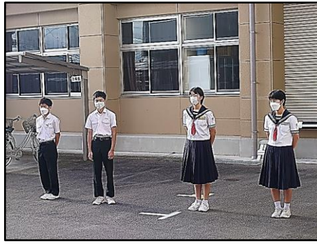
あいさつ運動の様子 ②