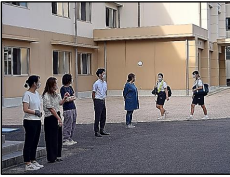
あいさつ運動の様子 ①