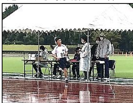
クロカンレースのゴール

主催：鹿島市教育委員会／嬉野市教育委員会／太良町教育委員会 鹿島嬉野藤津地区中体連