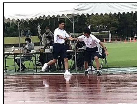
駅伝男子のたすき渡し