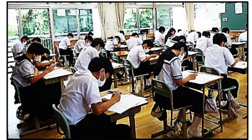
テストに真剣に取り組んでいました！

6月16日（木）・17日（金）の2日間の日程で国語・社会・数学・理科・英語の5教科の定期テストを実施しました。6月13日（月）から部活動を休止にして、学習に取り組むようにしていましたが、御家庭ではテストに向けて計画的に学習することはできていたでしょうか。1年生にとっては初めての定期テストとなり、テストに向けての学習方法やテストの受け方も初めての経験となったことと思います。テストの様子を見て回りましたが、皆さん真剣にテストに取り組んでいる姿が見られました。