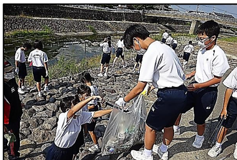
浜川の河原での清掃作業