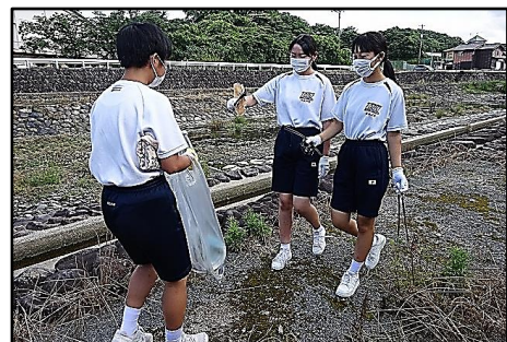
浜川の周りで清掃作業