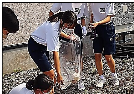
酒蔵通りでの清掃作業

6月8日(水)に生徒会の厚生委員会を中心にボランティア参加希望者で地域の清掃活動を行いました。この日は、部活動休みの日になっていましたので、帰りの会終了後に浜川周辺・酒蔵通り方面・浜駅方面の3コースに分かれて清掃活動を行いました。それぞれのコースでゴミ拾いを行い、16時30分前に体育館裏のごみステーションの前に集合して、ごみの分別を行い、解散しました。厚生委員会や自主的に活動に参加してくれたボランティアの皆さん、そして、支援をしてくださった先生方、ご苦労様でした。