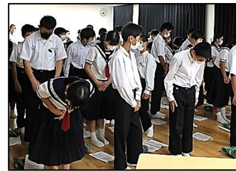
生徒の皆さんもお辞儀の練習を