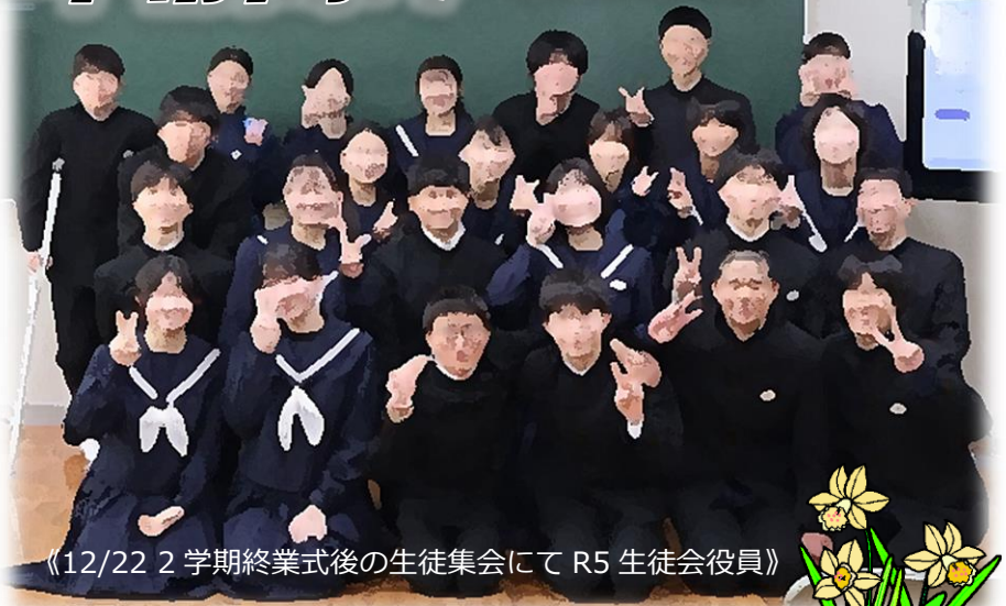
《12/22 2 学期終業式後の生徒集会にて R5 生徒会役員》