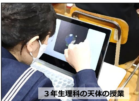
3 年生理科の天体の授業

文字には、人の心が表れるとよく言われます。美しい文字は、中心がしっかりとれていてバランスがいい。そして、丁寧です。