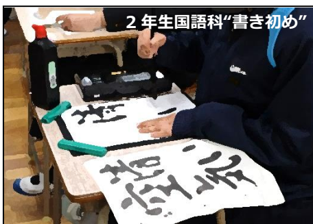
2 年生国語科“書き初め”

伝統は、人の思いの積み重ね。先輩達が残してくれたものを引き継ぎつつ、チャレンジするんだぞ。待っていても、文句を言っても何も変わらない。楽しみたいなら自分たちで考える。ルールは従うより、創る方がおもしろい。ますます自主性あふれる田代中を力を合わせて創っていけよ！