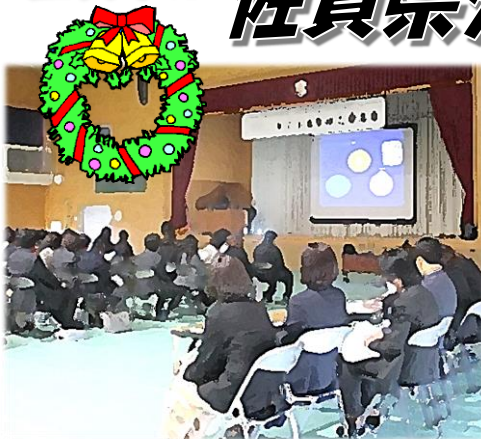
《体育館での全体会の様子》