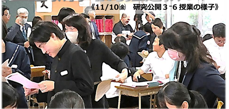
《11/10(金) 研究公開3-6 授業の様子》