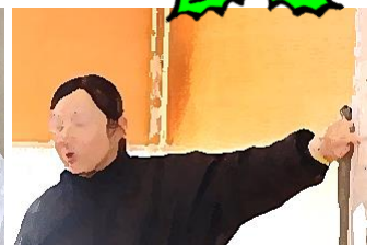
《西依教諭(保健体育科)》