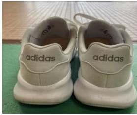
【かかと部のワンポイント】