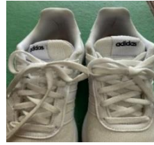
【タン部のワンポイント】