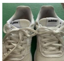
【タン部のワンポイント】

② 上履きは、学校指定のものとする。 ※学年毎に色を決めたもの（緑色、青色、赤色）