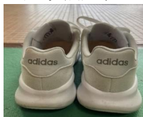
【かかと部のワンポイント】

① 通学靴は、保健体育等で使用するため、ひも付き白（単色）の運動靴（ジョギングシューズタイプ）とする。靴柄は、かかと又はタンの部分にワンポイントまでのもの。〔下図〕