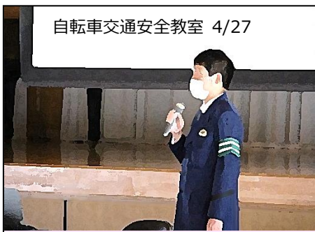
自転車交通安全教室 4/27

大きな楽器，小さな楽器。力強い音，優しい音，美しい音。全員が主役の明るい協奏が，1年生を歓迎します。