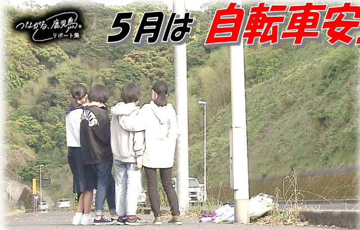
【NHK-TV 鹿児島放送局による高校生交通事故レポートから】