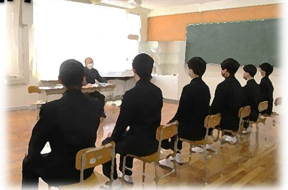
【3年生入試面接練習のようす 2/25】

さて、そのような状況の中、3年生は「県立高校一般選抜試験」に立ち向かい、学校では心をこめた「卒業証書授与式」の準備で少しずつ慌たじろさを増してきました。また、すでに進路を決めた3年生は、仲間分まで教室の整理など、学校を巣立つ用意をしてくれていました。そんな様子に、3年生との別れの日が来たことを実感しています。