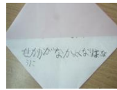
せいかいかなかよく なりますように

最後は、ペア学年で一緒に折り鶴を折りました。この折り鶴は、6年生が修学旅行に持っていき、長崎平和公園での平和集会で捧げてくるものです。全校みんなで平和への祈りを込めました。