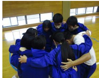
試合前の3年生の様子 気合いが入っています!!

ズマンの配置や試合間のチームの入れ替え、ギャラリーの応援席への移動などを生徒たちが互いに声を掛け合いながら素早く行っていたのです。この生徒主体の運営によるクラスマッチは、本校の学校教育目標である「自ら学び、仲間とともに伸びる生徒」の具体化された姿であり、多良中のレベルアップを感じさせたひとときでした。