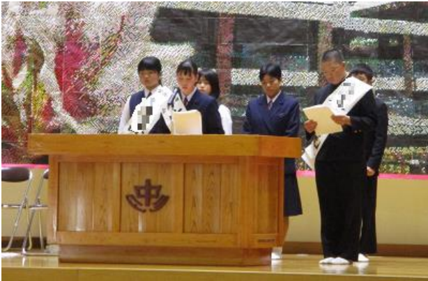
各学級からの質問に答える立候補者

演説会では、それぞれの責任者が立候補者を推薦する応援演説をした後、3名の立候補者が自らの公約を主張しました。それぞれの視点で多良中学校の現状をとらえ、「自分はどんな学校にしたいのか」、「何をどのように取り組むのか」を堂々と訴えました。生徒の目線で一生懸命に考えて真剣に演説する姿に2年生の成長を感じました。また、各学級から出されたいろいろな質問にも一生懸命に考えながらいてねいに答える姿がとても頼もしく見えました。