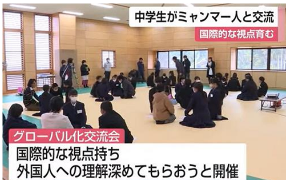
サガテレビ「かちかち Press」のニュース映像より

そのようなことから、先週、佐賀県(県庁国際課)と太良町の共催により、町内在住の外国人と1年生との交流会がありました。9名の外国人町民の方に来校していただき、「ミャンマーと太良町の繋がりを知ろう」をテーマとして様々な交流が行われました。ミャンマー語でのあいさつ、ミャンマーの衣装をまとっての踊りの披露、やさしい日本語ミニ講座など、生徒たちは始めは緊張した様子でしたが、次第にミャンマーの方々とも打ち解けて笑顔で交流会を楽しんでいました。