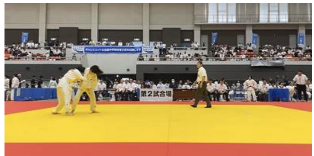
全国大会個人戦のようす(徳島県鳴門市)