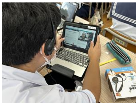
画面右上が外国人の講師です