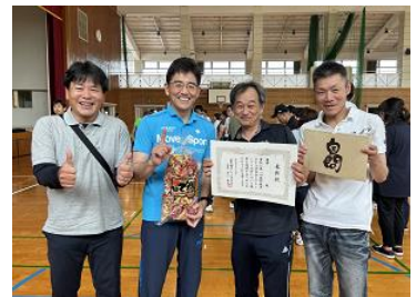
優勝した多良中PTAチーム

嬉野藤津PTA連合会第1回レクリエーション大会(6/24、吉田小)がありました。長年親しんできたミニバレーボールから3年間のコロナによる中止を経て、今回ポッチャに変更されて初めての大会となりました。地区内全14チーム(単P)が集い、参加者は気軽に楽しめるポッチャを通して親睦ができたと思います。多良中PTAは予選を1勝1敗で通過し、準決勝に進みました。準決勝では塩田小PTAとの接戦を4-3で制し決勝へ。大草野小PTAとの決勝では、多良中がナイスショットを連発して何と18-0の大差で優勝することができました。久しぶりに地区内のPTA活動の良さを味わうことができました。