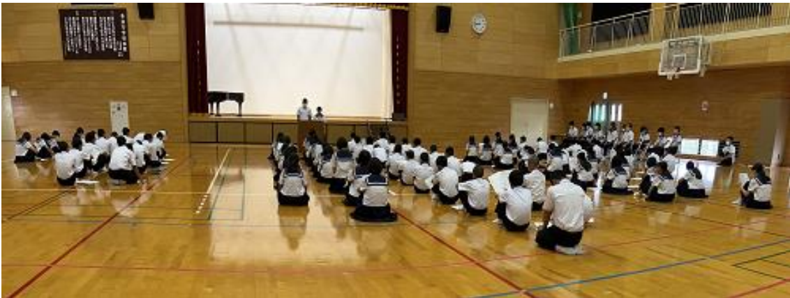
前に立って活動報告をする専門部長、右端は生徒会本部と各専門部長

本校は集会時の体育館への入場は無言で行うようになっていました。しかし、昨年は一列になっていなかったり、話し声が聞こえたりすることもありました。そこで、今年は無言入場を徹底しようということになりました。生徒集会の時は教室から体育館までの間に生徒会の本部役員が立って無言入場を促すようになりました。これもレベルアップの表れの一つだと思います。