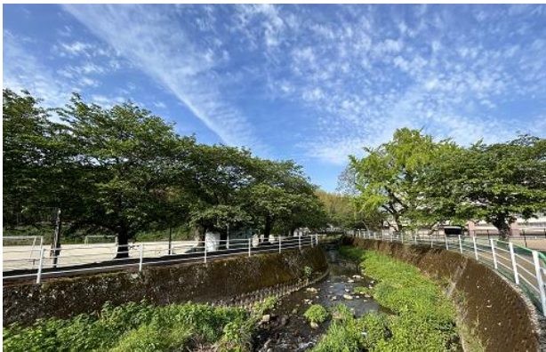
正門から嫁川上流を眺めて ※カラーで見るとより綺麗です

先日、今年度の高校入試の日程が発表された。多くの3年生が第一希望とするであろう県立高校の一般選抜は3月5、6日。この日まで約10か月。桜の蕾が膨らむ頃、3年生の皆さんはどうなっていたいか。そのためにこれからどのように過ごすのか。それは自分次第。嫁川沿いの桜は人に見られようがいがいが、今この時も来春に花を咲かせるための準備を日々重ねている。