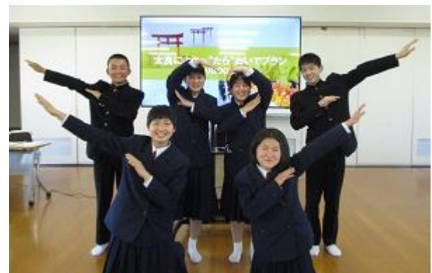
さが未来発見塾終了後の本校代表の6人