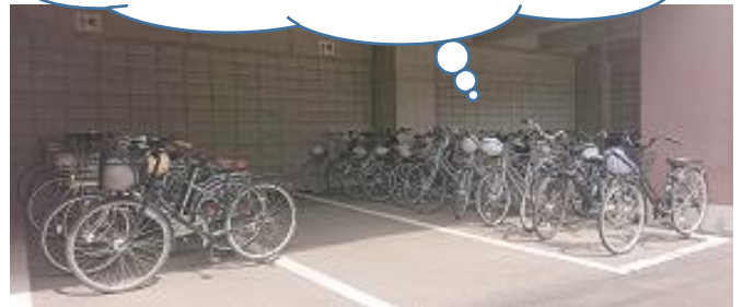
4月25日（月）の駐輪場のようす(2、3年生)

先週まで台数の多い2年生は枠からはみ出していましたが、今週は見事枠内に、きれいに収まっていました。