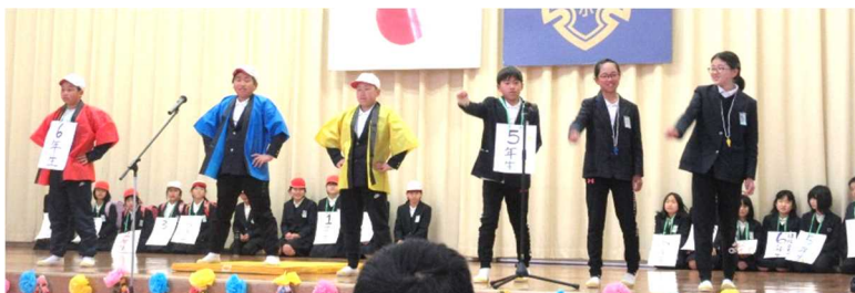
6年生はぼくらのヒーロー【劇とアンケート紹介】(5年生)