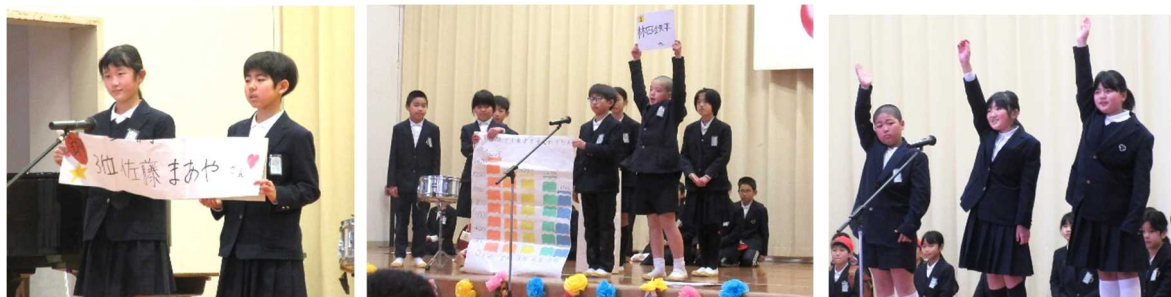
「何でもランキング6年生」(4年生) いろいろな資料から、6年生の頑張りをランキングにして紹介してくれました。