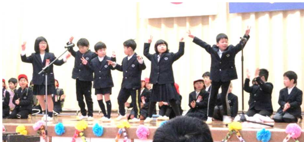
6年生へのおくりもの【劇】(1年生)