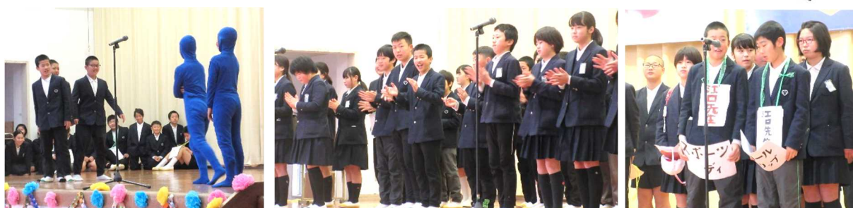
「時をかける6年！～先生あるある～」 ドラえもんが出てきました。ボディパーカッションをしています。いろいろな先生役もしました。

6年生は「時をかける6年！～先生あるある～」というタイトルで、これまでの6年間でいろいろな先生のエピソードなどを交えながら、寸劇にしていました。ドラえもんが出てきて、「どこでもドア」でタイムスリップするという設定にしたり、途中にボディパーカッションの演技を入れたりとなかなか斬新な発表でした。最後は先生方や在校生へのメッセージが心を打ちました。2度の発表、お疲れ様でした。