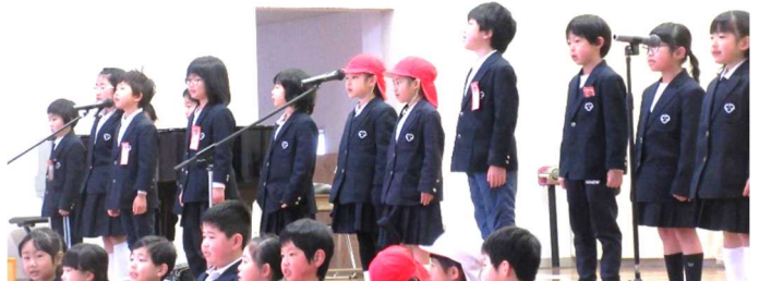
最後は「子犬のマーチ」の器楽合奏と歌でした。