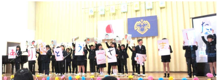
最後は感謝のメッセージです。