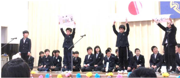
学校どこだろクイズ(3年生)