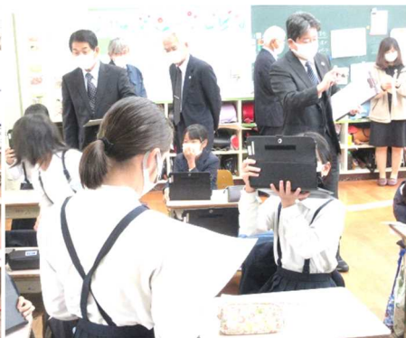
4年1組の国語の授業