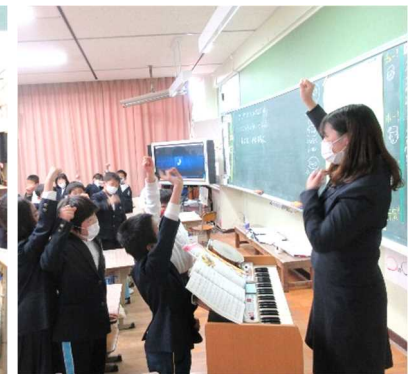
2年1組の音楽の授業