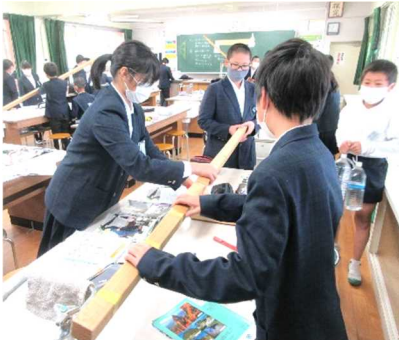
6年生の理科の授業