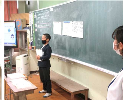
4年2組の算数の授業