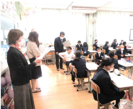
5年1組の道徳の授業