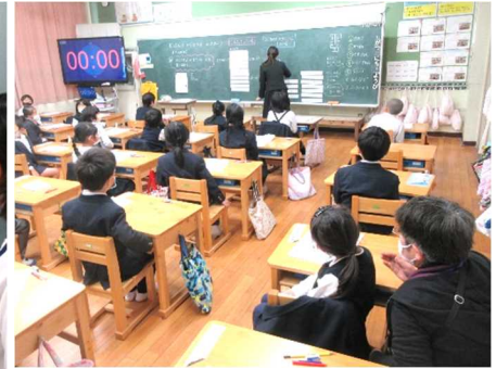
1年1組の学級活動の授業

この他にも、3年生の体育の授業や特別支援学級ひまわりの授業なども参観していただきました。参観終了後は、校長室で、これからの指導に向けて、ご感想やご助言をいただきました。