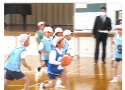
3年1組の体育の授業