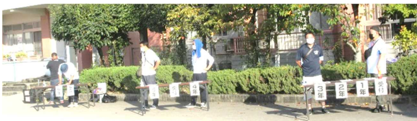
PTA体育部の皆さんには早朝から受付業務を行っていただきました。

また、当日は、新型コロナウイルス感染防止対策として、参観者の入場制限をさせていただくこととなり、また、参観者も検温、アルコール消毒、名札の着用、名簿確認などいろいろとご負担をおかけすることとなりました。特にPTA各専門部の皆様には早朝から受付、駐車場整理、受付、会場見回りなどを行っていただき、また、競技中は、写真記録などもしていただきました。ありがとうございました。