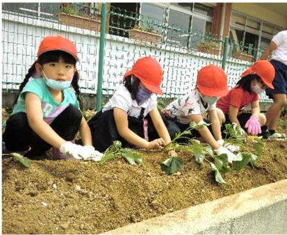
初めて、芋さしをしている1年生

さて、4日は1・2年生が地域の方のご指導を受けながら、楽しく芋さしを行いました。また、5月21日に糶まきをした5年生は、6月21日（月）にPTA 厚生部の皆さんの協力を得て、田植えに取り組みます。6月は梅雨の季節ですが、この時期だからこそ取り組むことができる行事もたくさんあります。梅雨の季節も体調に気を付けて、快適に過ごしてほしいと思います。