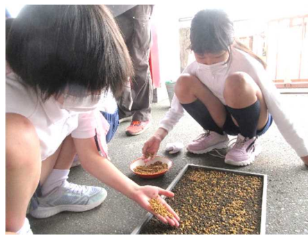
糶まきをしている5年生