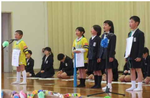
2年生は劇で感謝の気持ちを伝えます