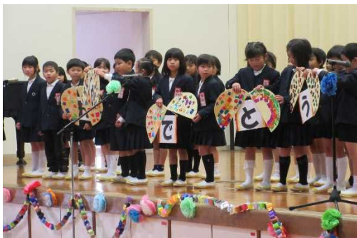
1年生もありがとうメッセージです