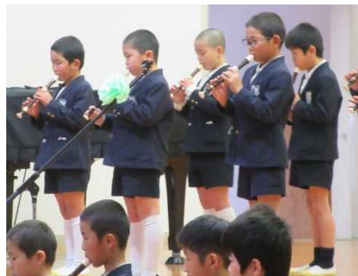
リコーダーの音色がきれいです(3年)