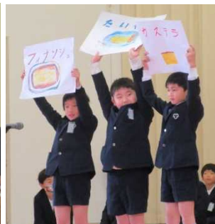
横山先生が好きなものクイズ(2年) 最後は「ありがとう」メッセージ(2年)