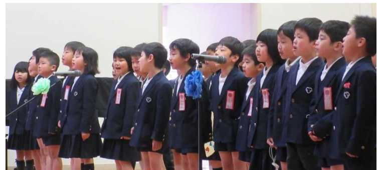
気持ちを込めて、元気よく歌います(1年)