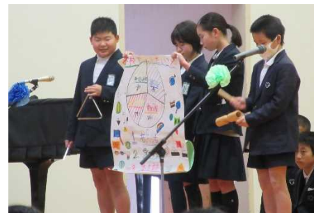
中学校でやりたいことの結果発表(5年)