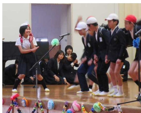
赤白帽子のウルトラマンかぶり懐かしい(6年)