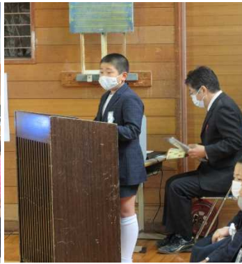
第一部の司会を務める大樹さん