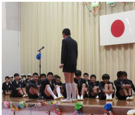
國光先生がカッコよかったです。(6年)

6年生は「ぼくたちの多良小あるある」というタイトルで、これまでの学校生活を振り返り、ときにはユーモアも交えながら、寸劇による楽しい発表をしてくれました。「あるある」と言い、うなずきながら見ている在校生や「くすっ」と笑っている在校生がたくさん見られました。最後は、「帰りの連絡」という形で、これまでの感謝の気持ちや在校生への期待などを伝えてくれました。まさに、普段の学校生活をパッケージにした中で、6年生の温かい気持ちや「中学校でも頑張るぞ!」といった意気込みが伝わってくる発表だったと思います。2度の発表、お疲れ様でした。