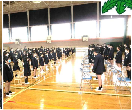
歌のプレゼント「思い出のアルバム」