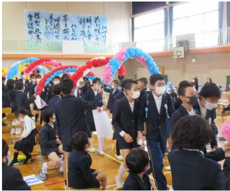
花のアーチをくぐって6年生の入場