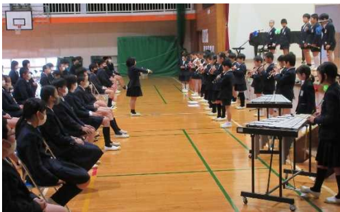
3年生による器楽合奏で「パフ」を演奏