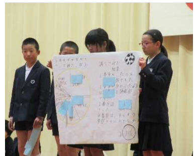
アンケートの発表(5年)