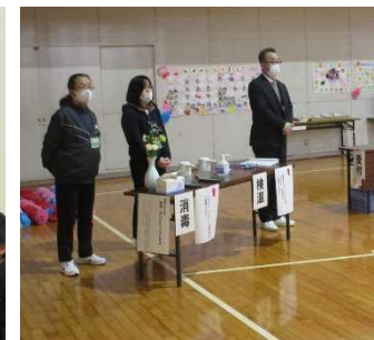
感染防止対策もばっちり

6年生は「ぼくたちの多良小あるある」というタイトルで、これまでの学校生活を振り返り、ときにはユーモアも交えながら、寸劇による楽しい発表をしてくれました。「あるある」と言い、うなずきながら見ている在校生や「くすっ」と笑っている在校生がたくさん見られました。最後は、「帰りの連絡」という形で、これまでの感謝の気持ちや在校生への期待などを伝えてくれました。まさに、普段の学校生活をパッケージにした中で、6年生の温かい気持ちや「中学校でも頑張るぞ!」といった意気込みが伝わってくる発表だったと思います。2度の発表、お疲れ様でした。