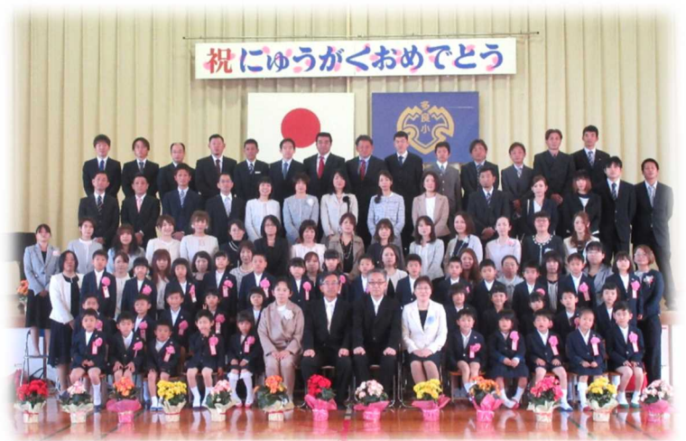
新入生と保護者、学級担任と校長、教頭の集合写真です。

在校生は参加できませんでしたが、式終了後に、全ての学級の子どもたちからの入学祝いメッセージを放映し、在校生からのお祝いの気持ちを伝えました。多良小学校のよいところや1年間の学校行事を紹介してくれた学級もあり、心のこもったメッセージになっていました。また、校歌斉唱についても、前日に6年生が体育館いっぱいに広がって歌ってくれた多良小学校校歌を録音し、放送しました。前日の体育館掃除や準備、1年生教室の飾りつけなども6年生が中心となって頑張ってくれました。