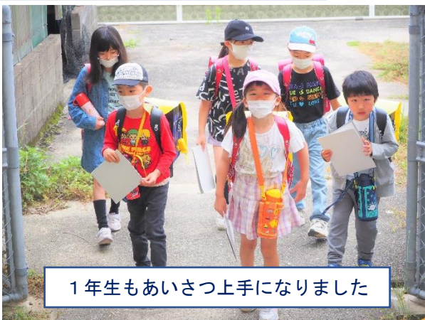
1年生もあいさつ上手になりました