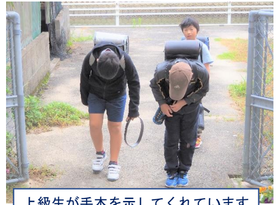
上級生が手本を示してくれています

4、5月の生活目標は、「気持ちの良いあいさつと返事をしよう」でした。田野小学校が力を入れているのは、あいさつプラスワンです。ただ、あいさつするだけでなく、立ち止まって、相手を見て、お辞儀をして、相手の名前を言ってなどのプラスワンです。子どもたちの多くが、職員室裏側の校門から登校してきます。ほとんどの子どもが、この門のところであいさつをして、お辞儀をするのです。また、「おはようございます〇〇先生」と名前を言ってあいさつをする子もいます。あいさつを交わすことによってお互いがよい気持ちになります。