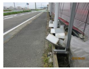
⑭ 歩道にハウスの金属