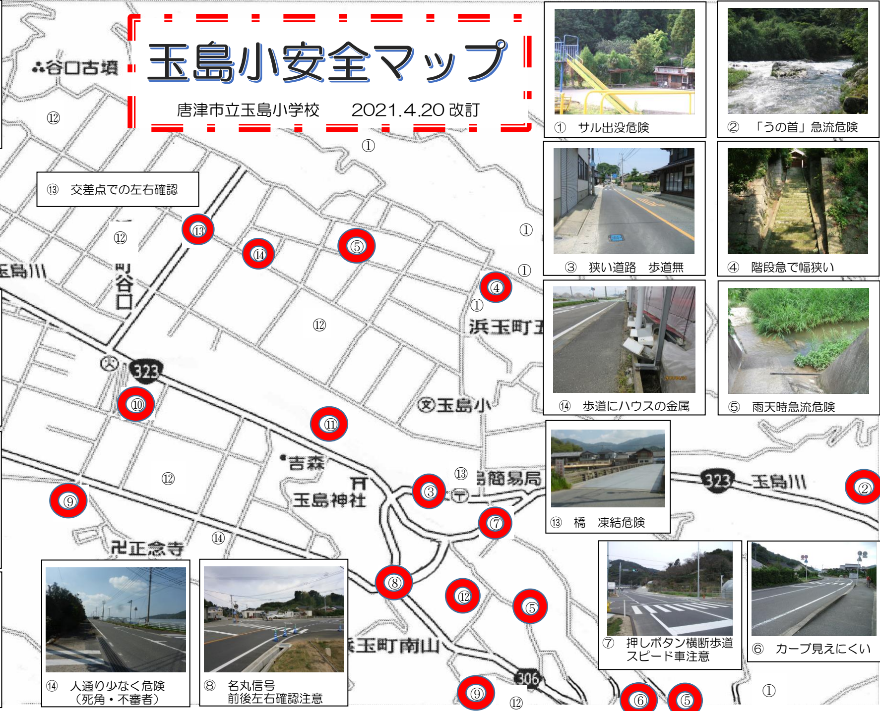
⑬ 交差点での左右確認