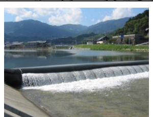
⑪ 玉島川えん堤深み有