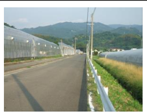
⑫ ハウス多く死角有