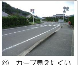
⑥ カーブ見えにくい