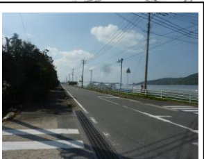
⑭ 人通り少なく危険 (死角・不審者)