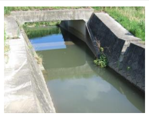
⑩ 浄水場東水路深み有