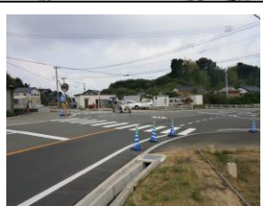
⑧ 名丸信号 前後左右確認注意