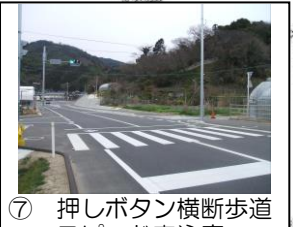
⑦ 押しボタン横断歩道 スピード車注意