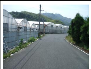
⑨ 大型トラック多い