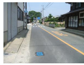
③ 狭い道路 歩道無