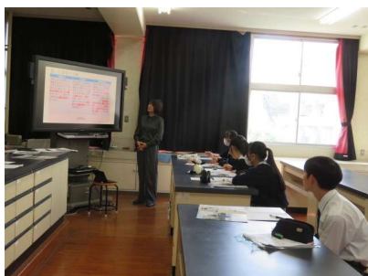
介護福祉士と社会福祉士のちがひ

職業理解の一環として、似ているようで違いがある職業(介護福祉士と社会福祉士など)について理解を深め、進路を考える際の一助となるよう、それぞれの進路に合わせて、各種学校の講師から講話をいただき、生徒たちは熱心に耳を傾けていました。