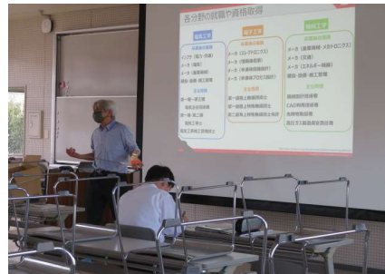
電気/電子/機械のちがひ