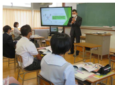
経済学と経営学のちがい