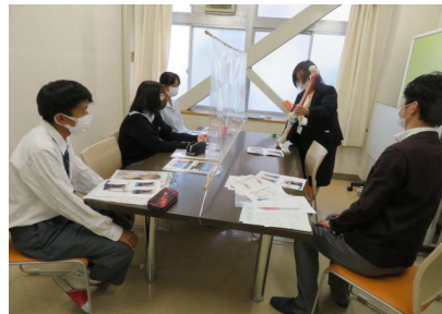
理学療法士と作業療法士のちがい

職業理解の一環として、似ているようで違いがある職業（理学療法士と作業療法士など）について理解を深め、進路を考える際の助となるよう、それぞれの進路に合わせて、各種学校の講師から講話をいただき、生徒たちは熱心に耳を傾けていました。