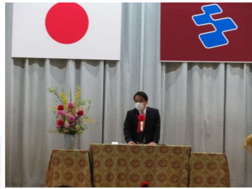
教育後援会名誉会長の祝辞