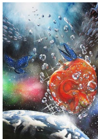
県総文祭特選作品