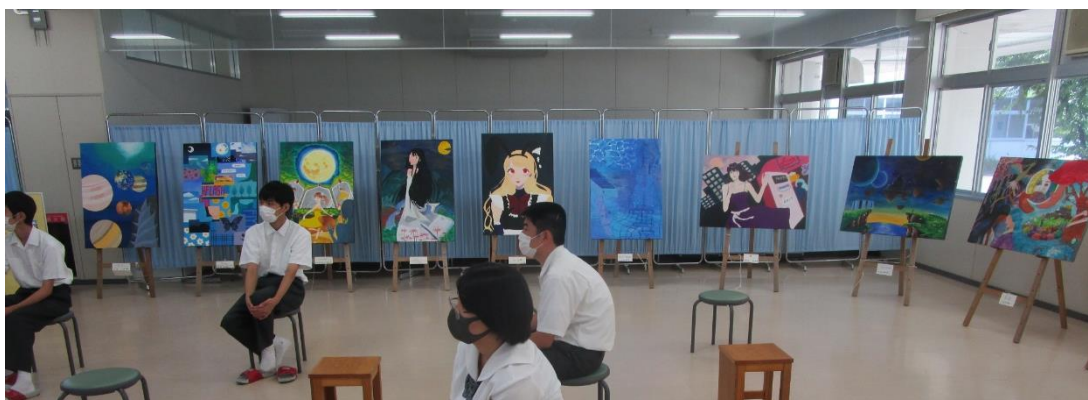
多久高祭（文化祭）美術部作品展の様子