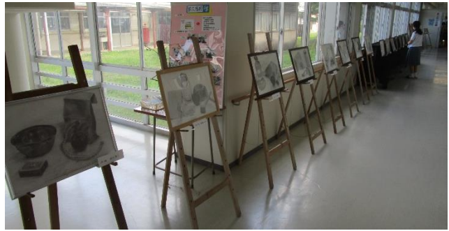
多久高祭（文化祭）美術部作品展の様子