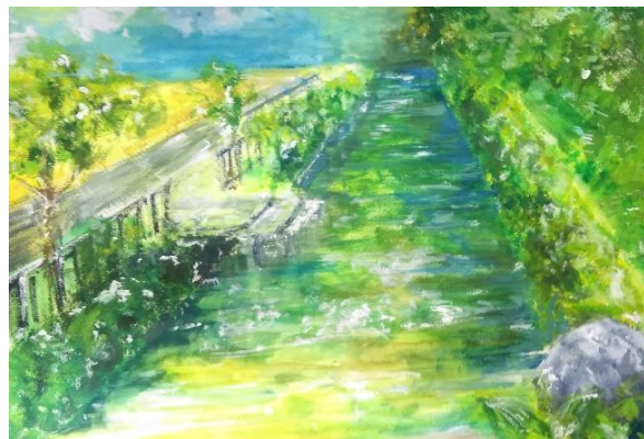
スケッチ大会特選作品