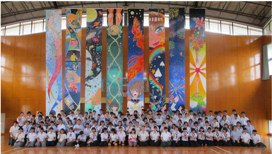
県高校美術・工芸研修講座（2白3日：波戸岬合宿）