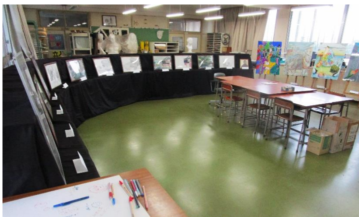
多久高祭（文化祭）美術部作品展の様子