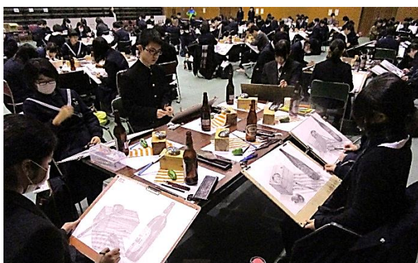
デッサン大会の様子