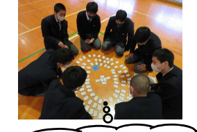
高い位置からだ、探しやすいぞ。