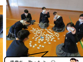
得意札 取ったよ～☺ 「巧言令色 鮮なし仁。」