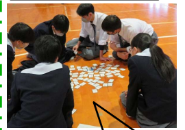
集中力と瞬発力が大事。