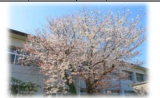
福祉棟と工業棟の間の山桜です。青い空に桜色が映えますね。