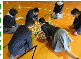
遠慮なく取ります。☺

「論語かるた」のクラスマッチが行われました。読み手は生徒会役員が行い、1チーム3人でかるたを取り合いました。上の句を読み始められたら、目を皿のようにして取り札を探しました。「あ～それ取れたかった～」。「目の前にあったのに～」と悔しがったり、「速い!」「すごい!」と感嘆したり、同じ頭文字の句にお手付きをするなど和気あいあとした雰囲気でした。