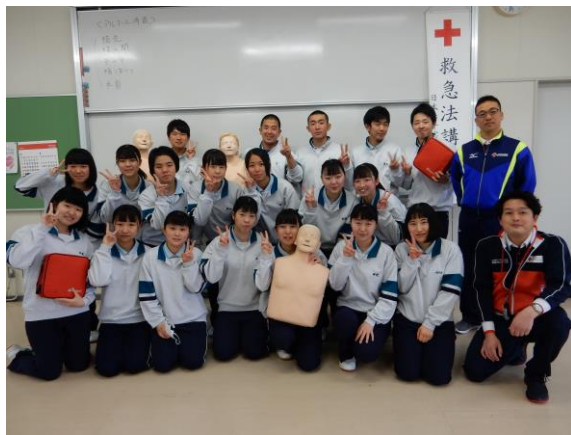
健康福祉系列2年生19名が受講し、心肺蘇生法やAEDの使い方について学んだ。