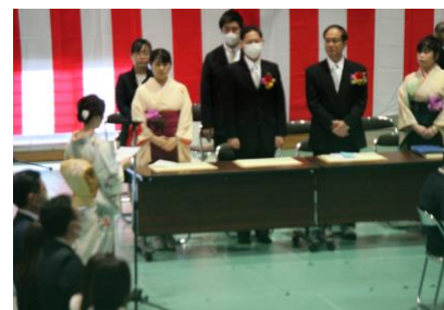
保護者代表あいさつ