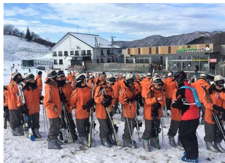
早速、スキー板とストックを手にして。