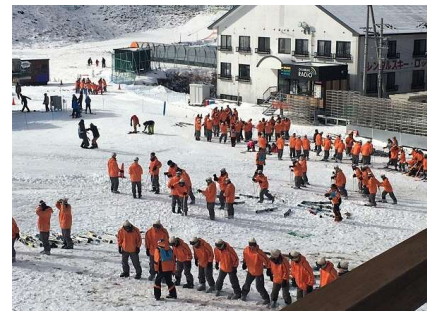
スキー教室受講中、...