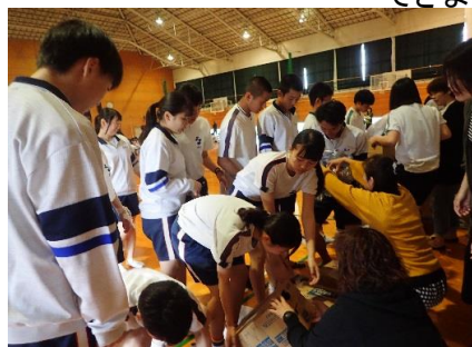
学校出発時に後援会の保護者 より飲料水をいただきました。

4月26日(金)開校記念行事で 多久聖廟に遠足に行きました。当日は天候に恵まれ 爽やかな風を感じながら、友達や先生と歩くことが できました！