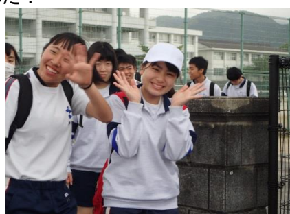
元気に学校を出発～！