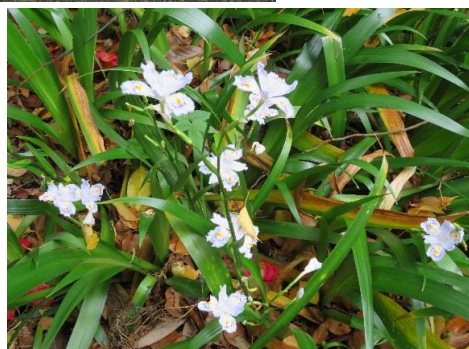
綺麗な花も歓迎してくれました。